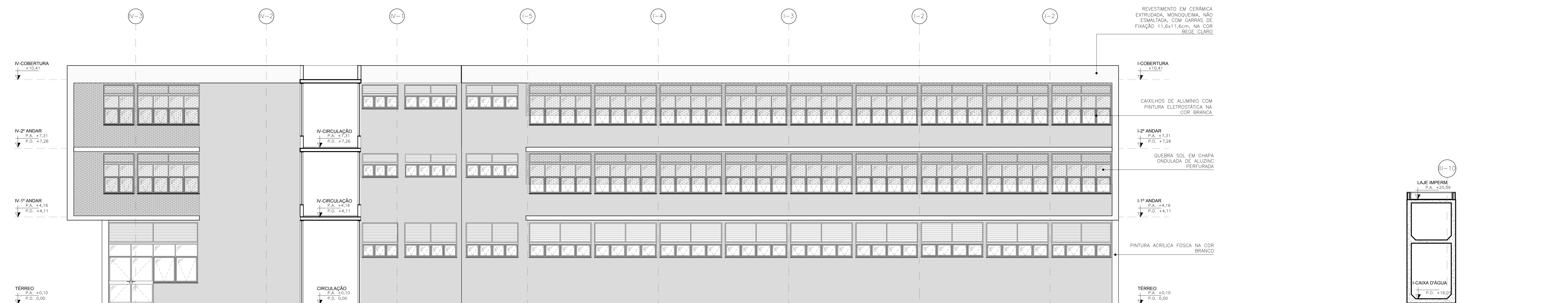
ELEVACÃO INTERNA 02 ESCALA 1:75