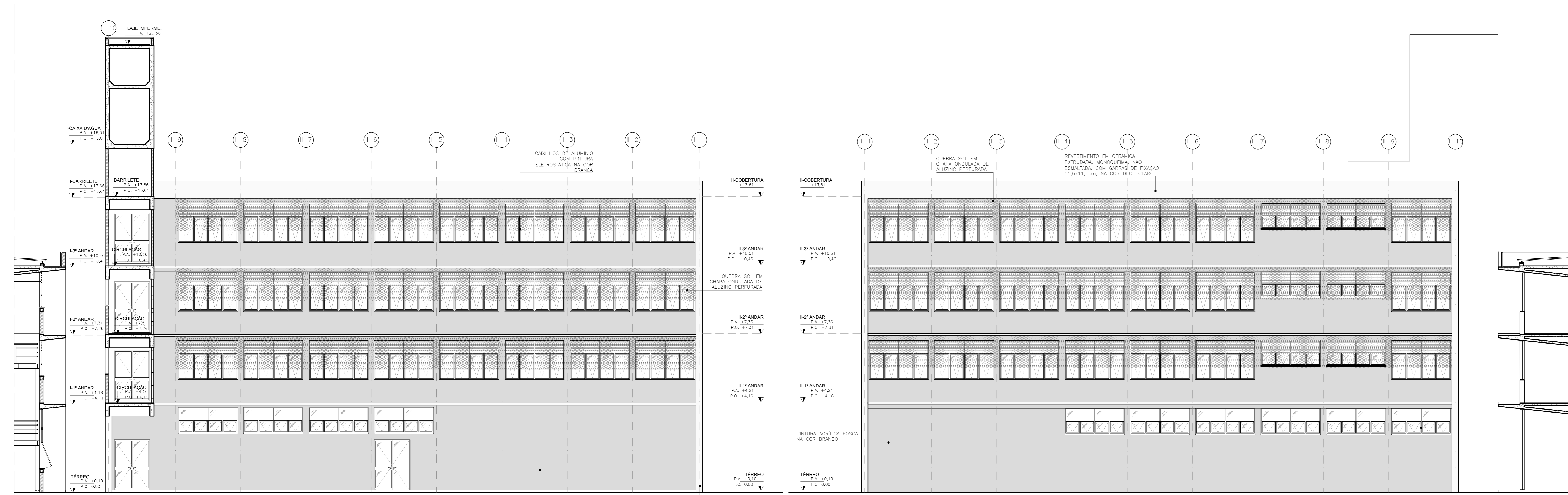
ELEVACÃO INTERNA 03 ESCALA 1:75