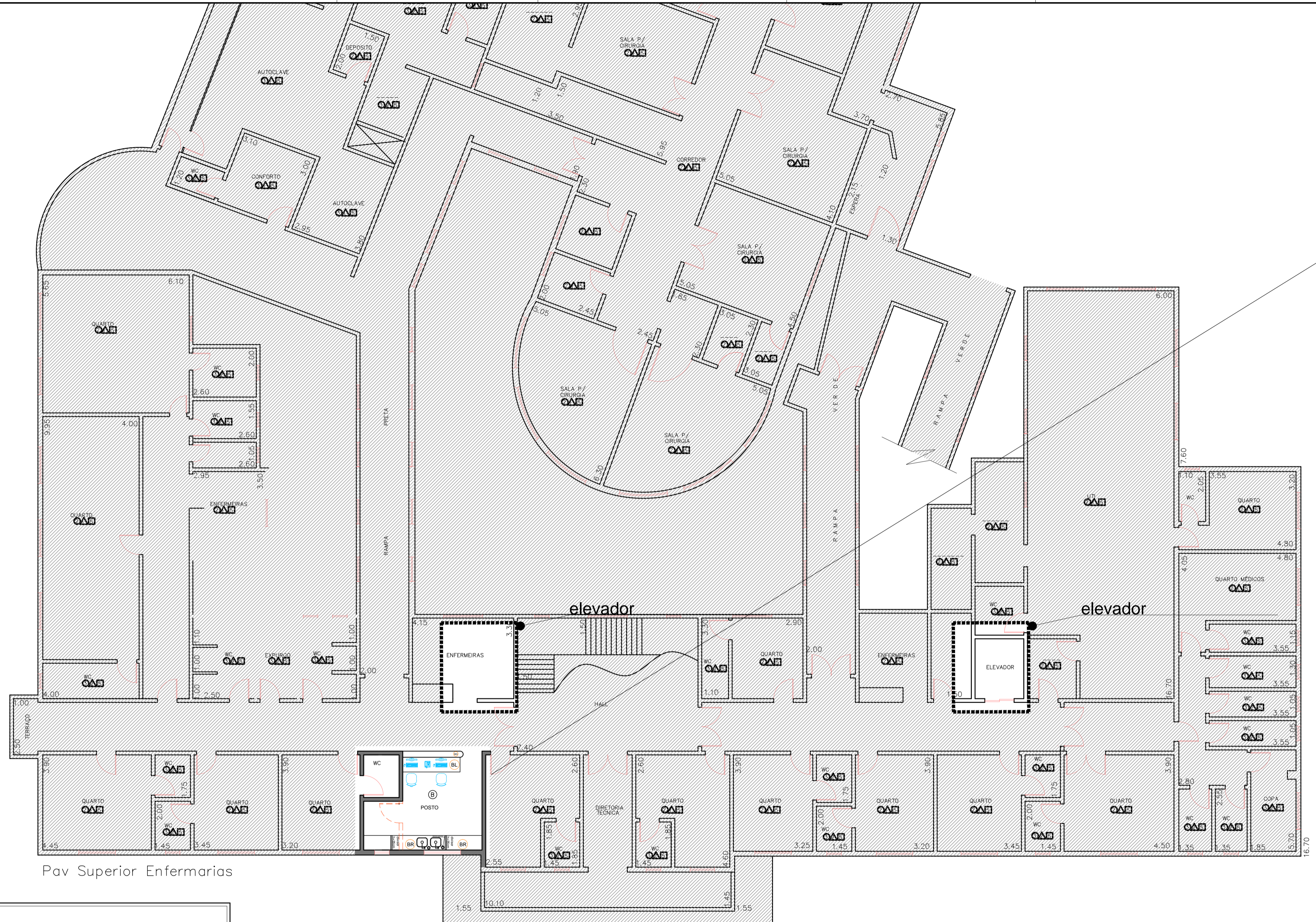
Pav Superior Enfermarias