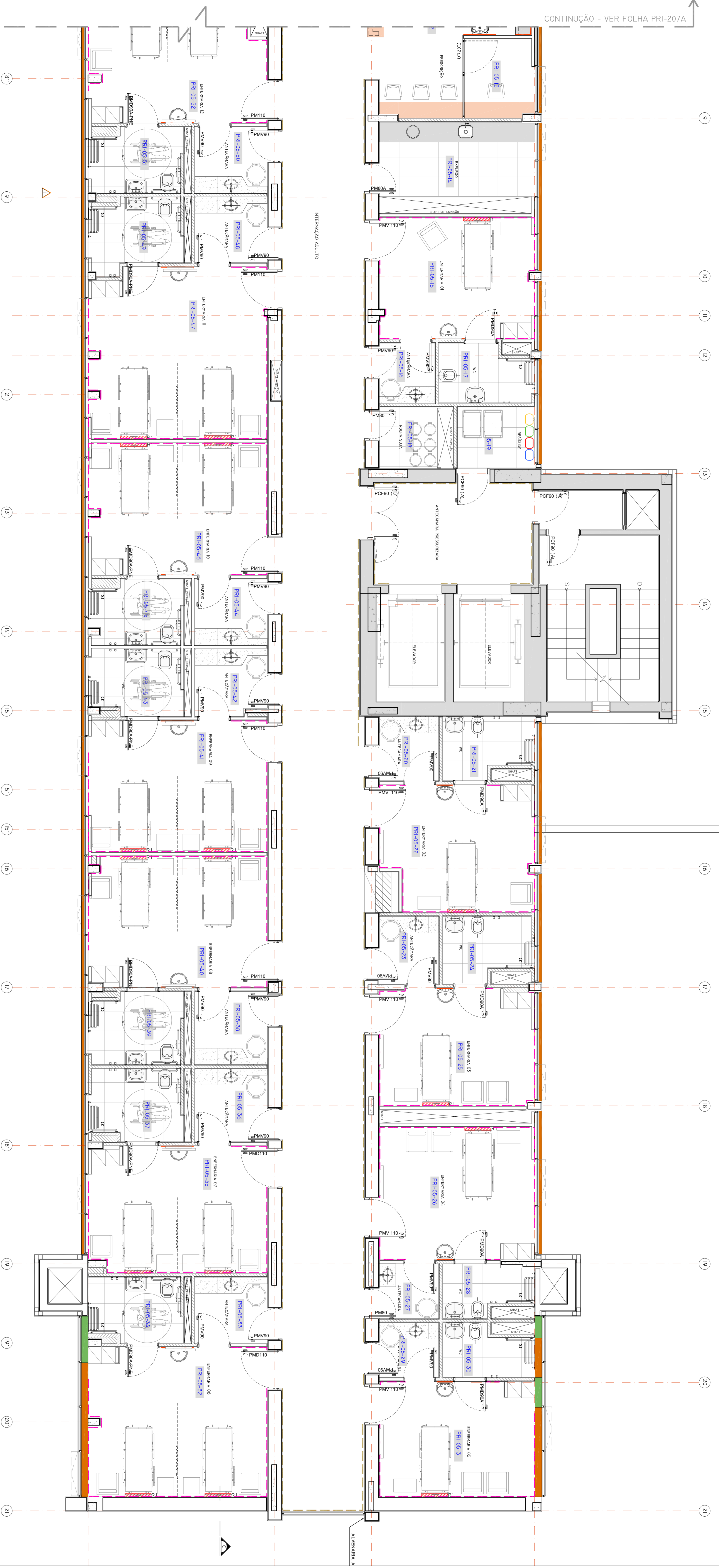
PLANTA DE LAVORO - 5º PAVIMENTO