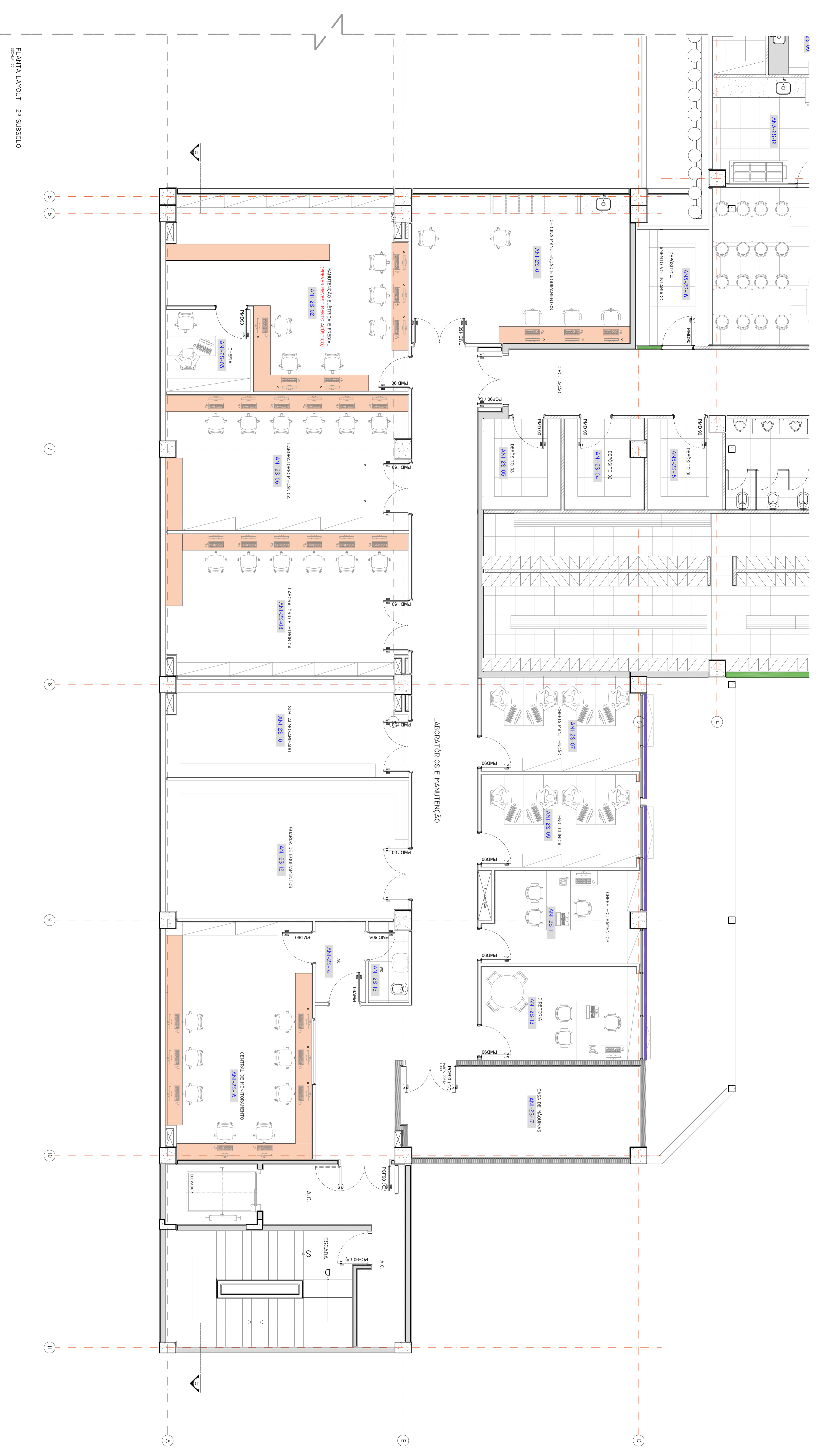
PLANTA LAYOUT - 2º SUBSÓLO