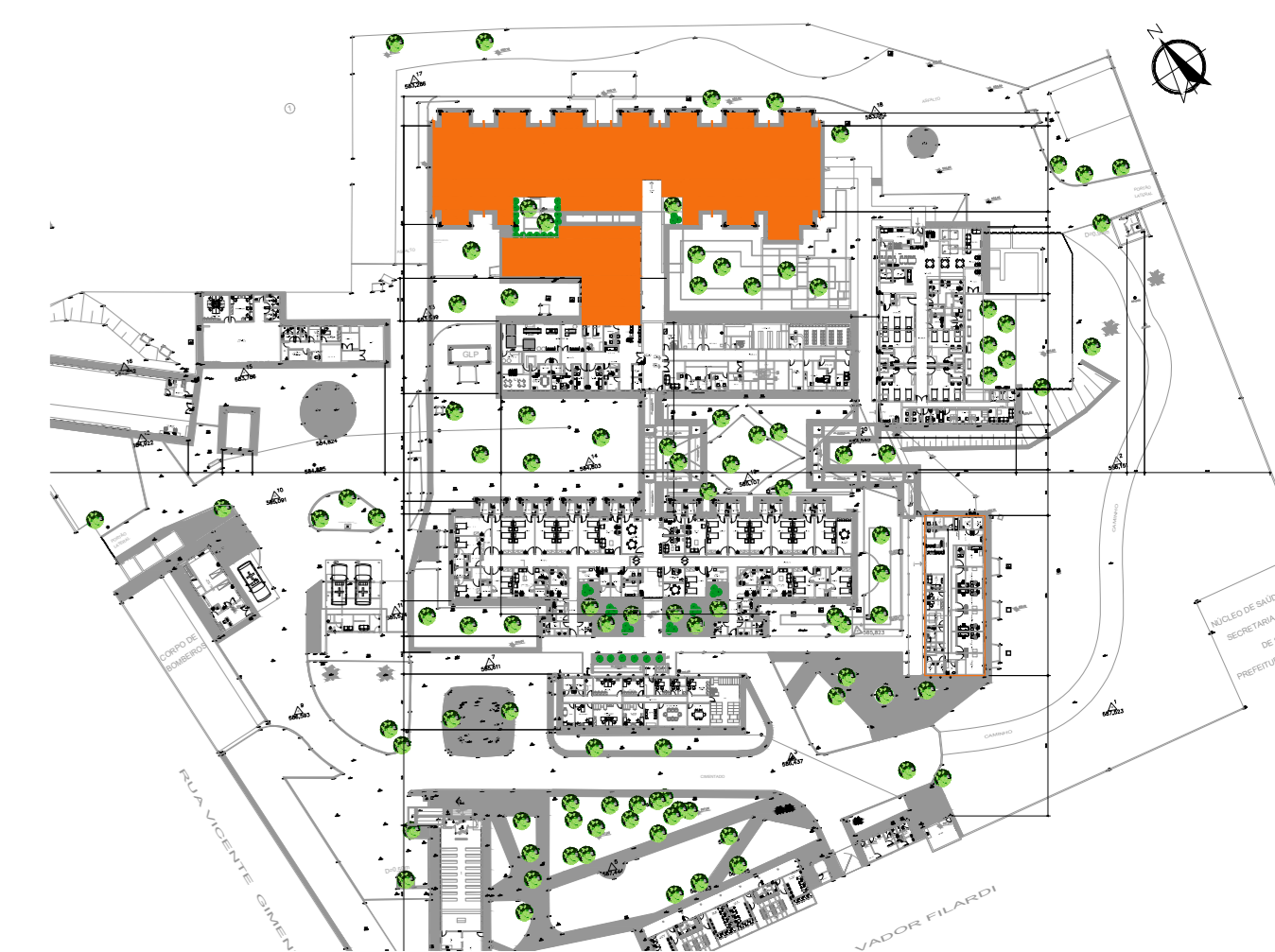
PLANTA DE LOCALIZAÇÃO