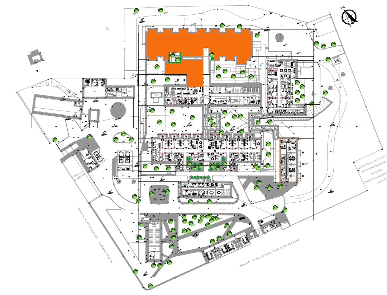
PLANTA DE LOCALIZAÇÃO