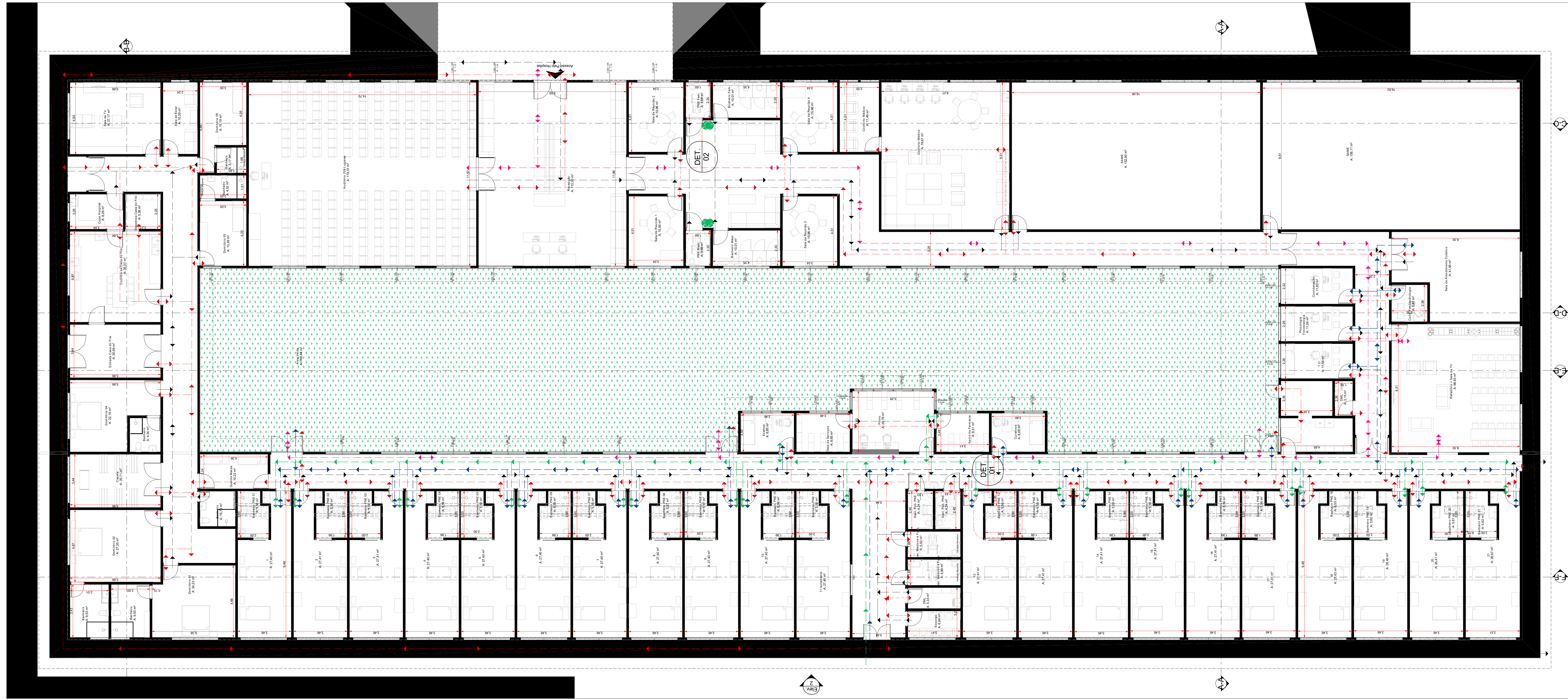
TÉRRO - 1:100