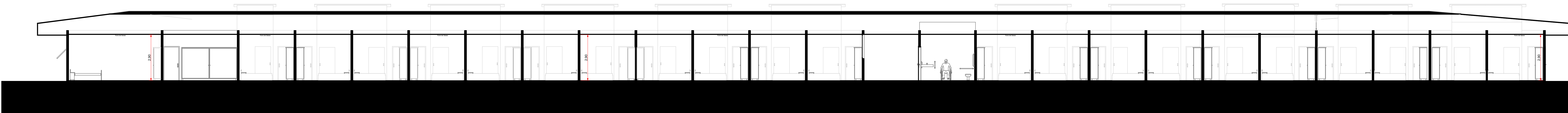
CORTE F-F 1:200