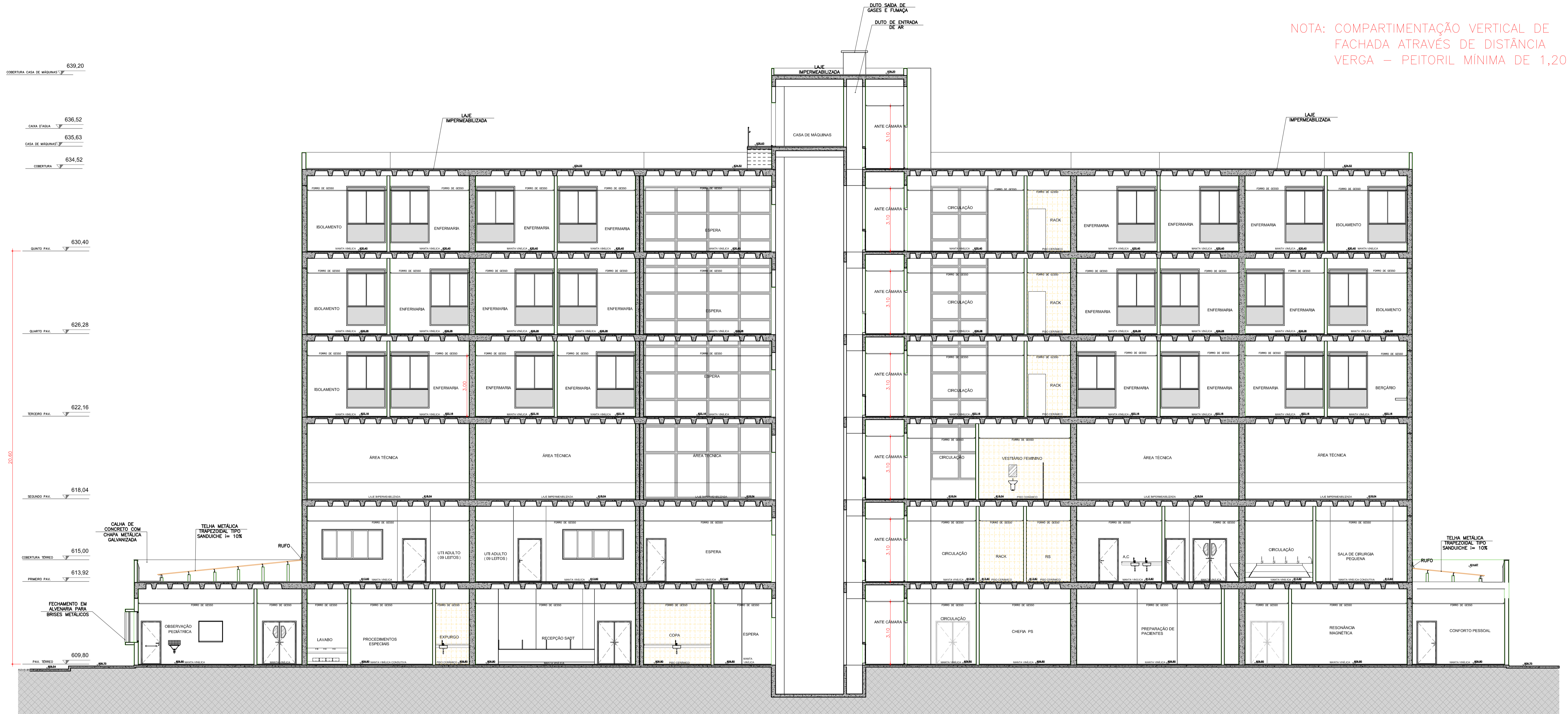
CORTE AA - BLOCO 01