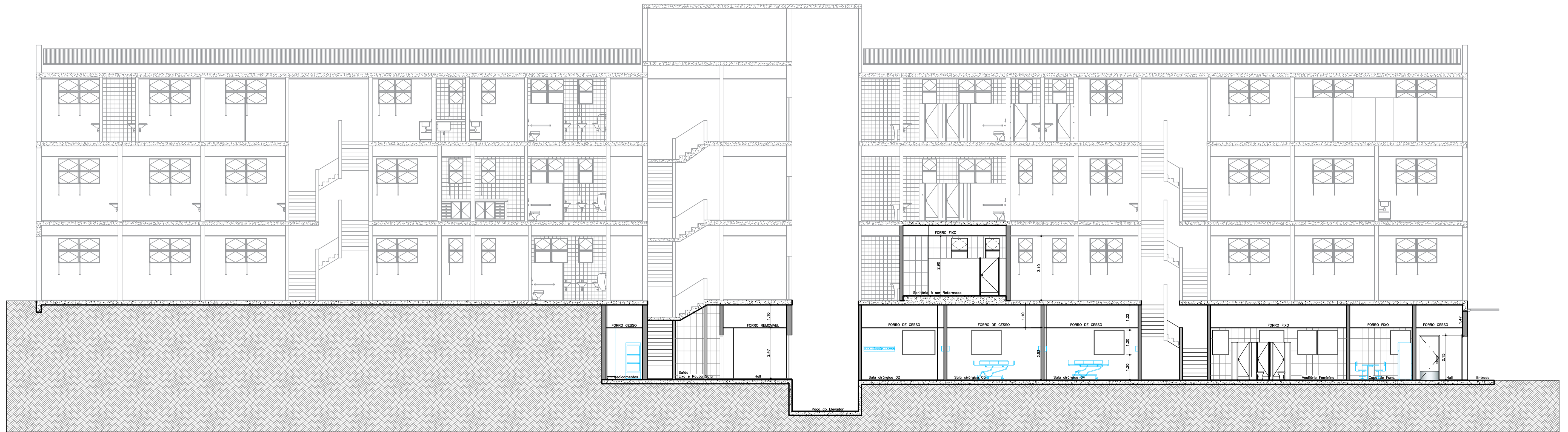
● CORTE AA