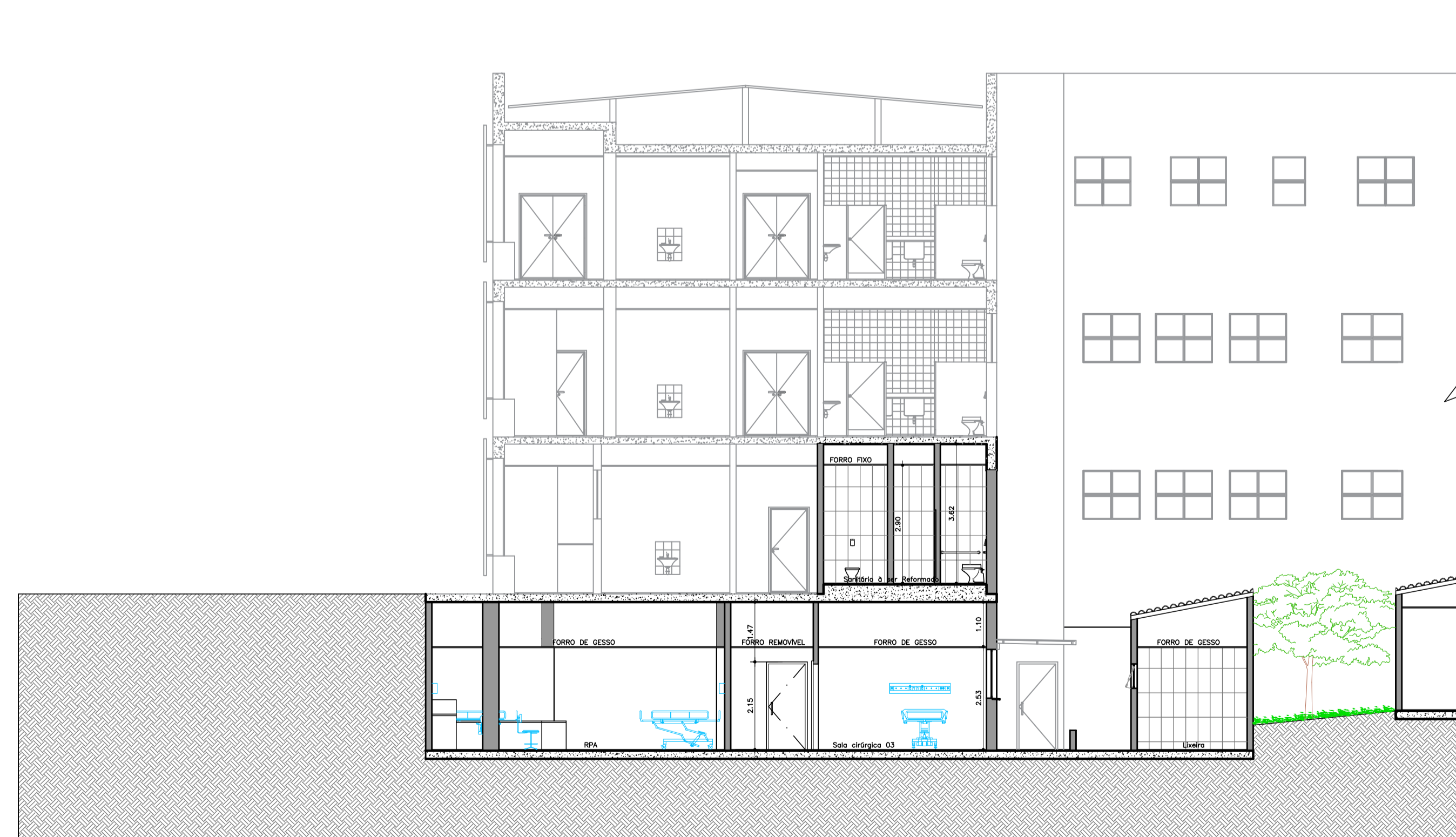
● CORTE CC