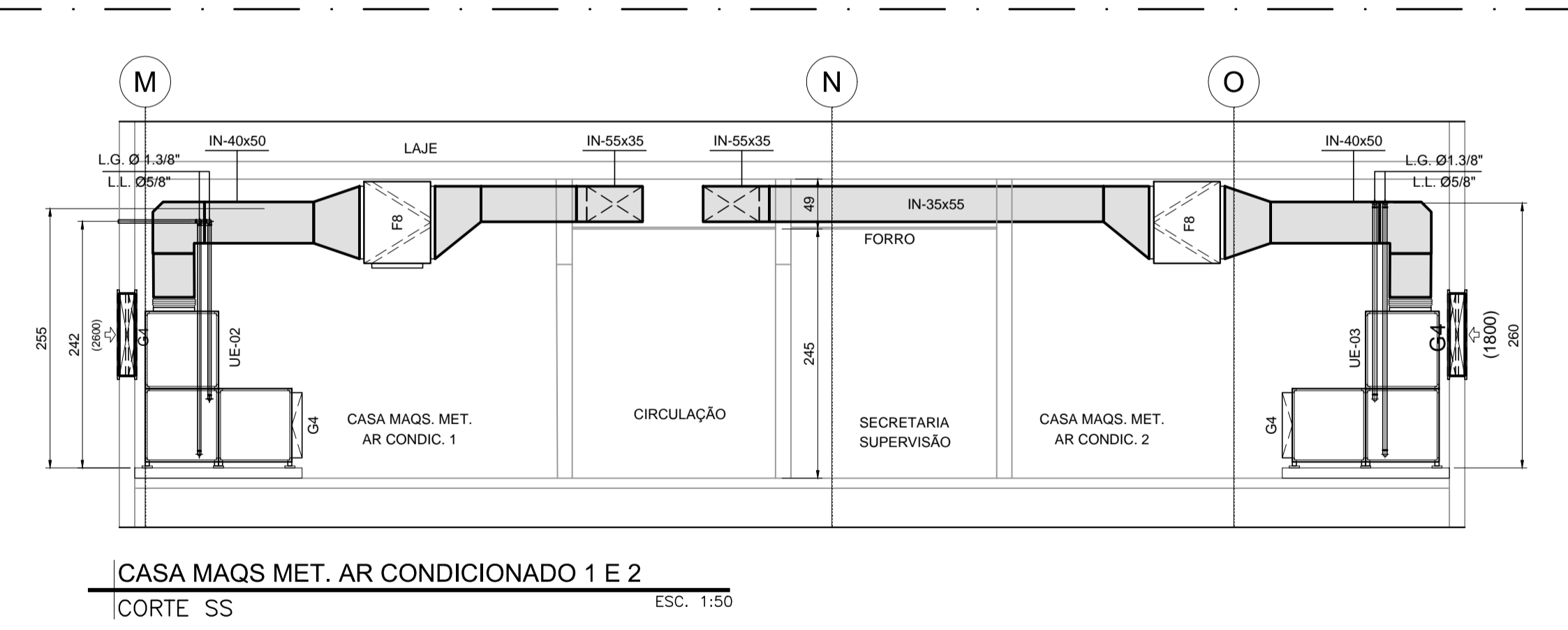
CASA MAQS. MET. AR CONDICADO 1 E 2 CORTE SS ESC. 1:50