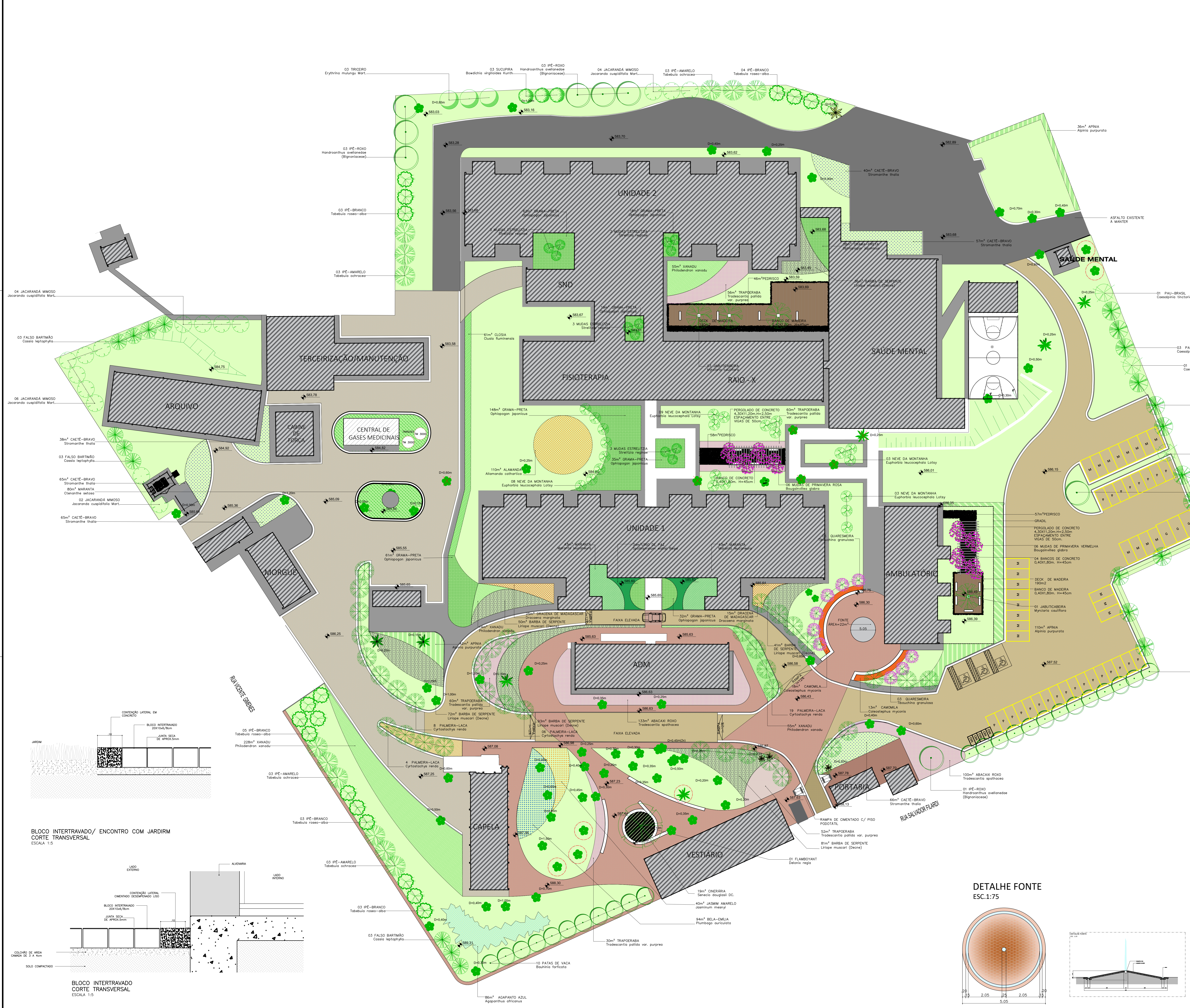
DETALHE FONTE ESC.1:75