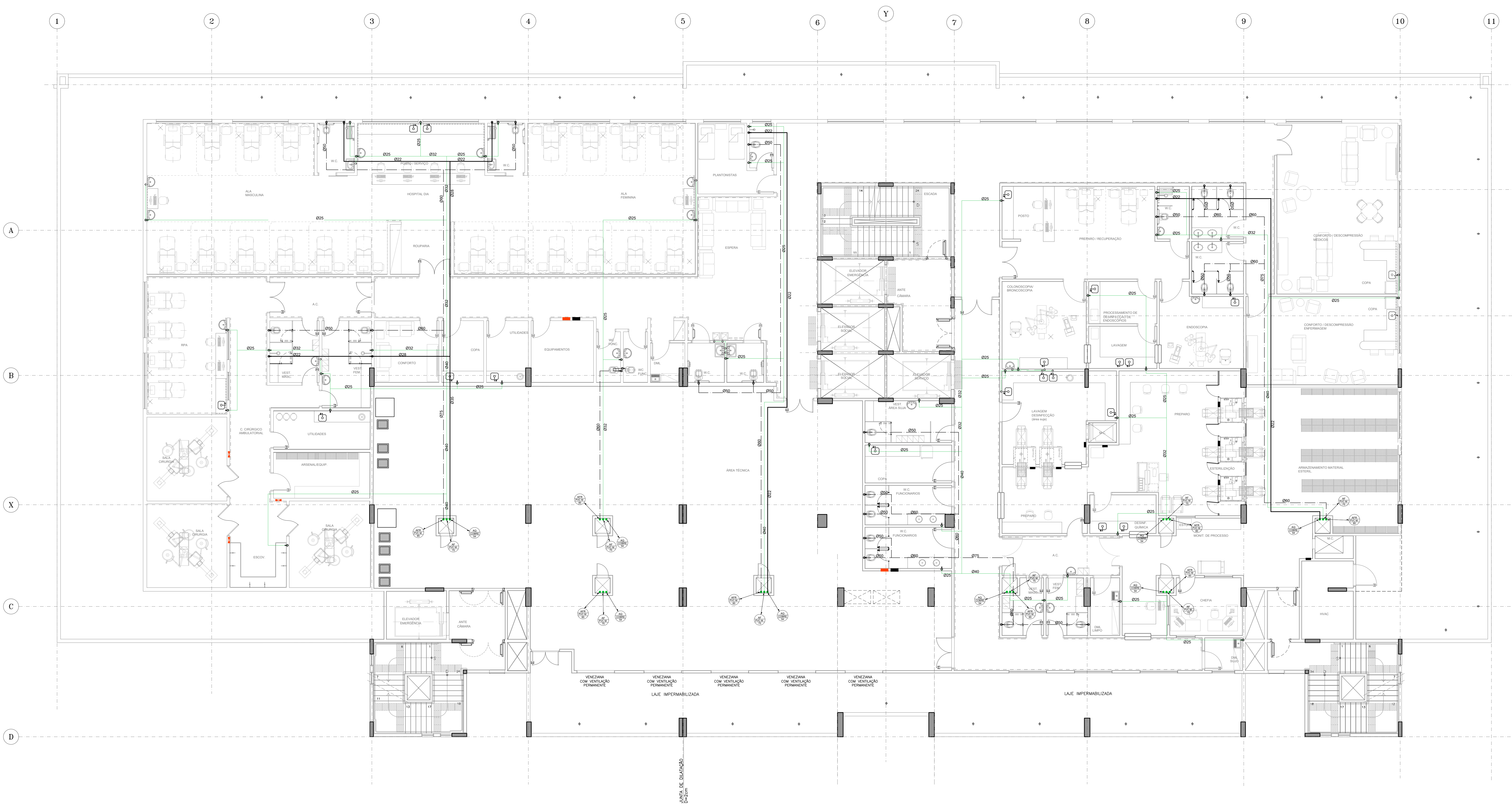
PLANTA 2º PAVIMENTO - AGUA FRIA / AGUA QUENTE / AGUA REUSO ESC.1/25