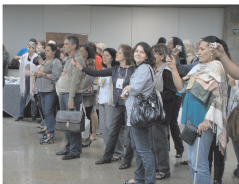
Grupo Miryoku Daiko, formado por crianças descendentes de japoneses, apresentou o Taikô, tambores da cultura nipônica que quando tocados podem expressar sentimentos de alegria, ira, tristeza e prazer. A platéia registrou tudo