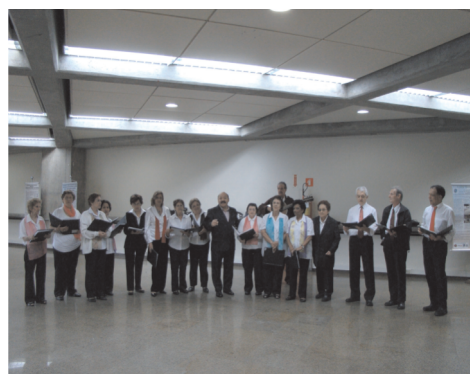
Momento encantamento. O coral da 3ª Idade apresentou música de qualidade aos conferencistas