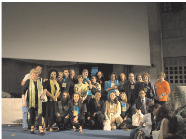
E todos juntos, ao final da 1ª Cesa SP, com o sentimento de dever cumprido