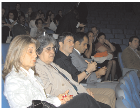
Centro de Vigilância Sanitária e Instituto Adolfo Lutz presentes prestigiando a 1ª Cesa SP