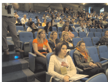
A Coe na platéia. Um olho na organização, outro nas discussões que pautaram os dois dias do evento