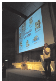
O programa Agita São Paulo esteve presente e levou a mensagem dos 30 minutos que fazem a diferença. Como sempre, levantou a platéia