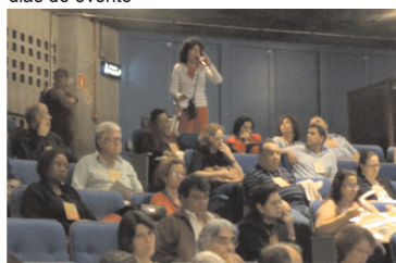
Os microfones circularam entre os conferencistas e garantiram a palavra a todos