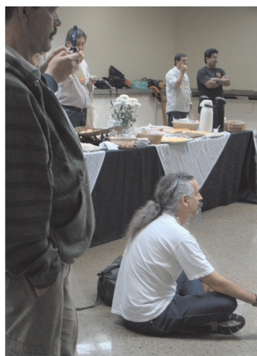
...e o guerreiro aproveitou para um breve descanso