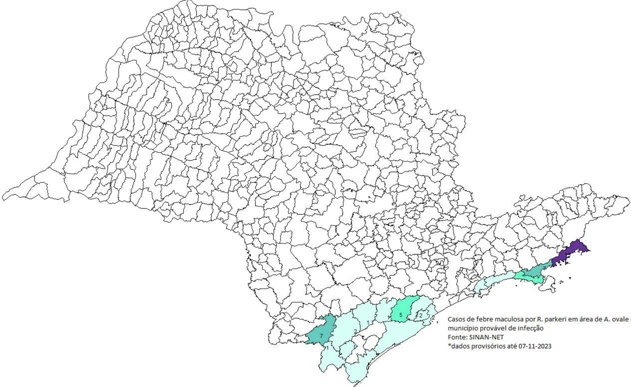
Casos de febre maculosa por R. parkeri em área de A. ovale do estado de SP de 2007 a 2023* por município provável de infecção Fonte: SINAN-NET *dados provisórios até 07-11-2023