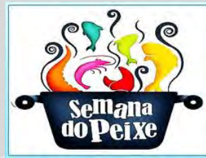
Campanha de aumento ao consumo da pesca (Ministério da Pesca)