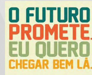
Campanha: Associação Brasileira de Agências de Publicidade - ABAP, ABP, empresas privadas