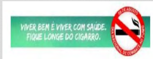
Campanha de Combate ao Fumo