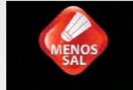
ABRAS: Ass. Brasileira de Supermercado: campanha de redução do sal