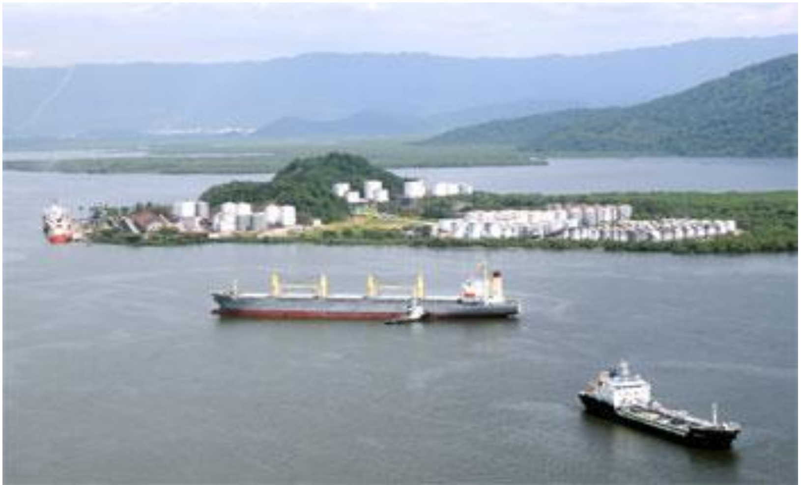
ILHA DE BARNABÉ -SANTOS